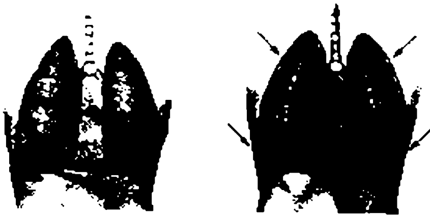
شكل الحجاب الحاجز أثناء عملية التروية