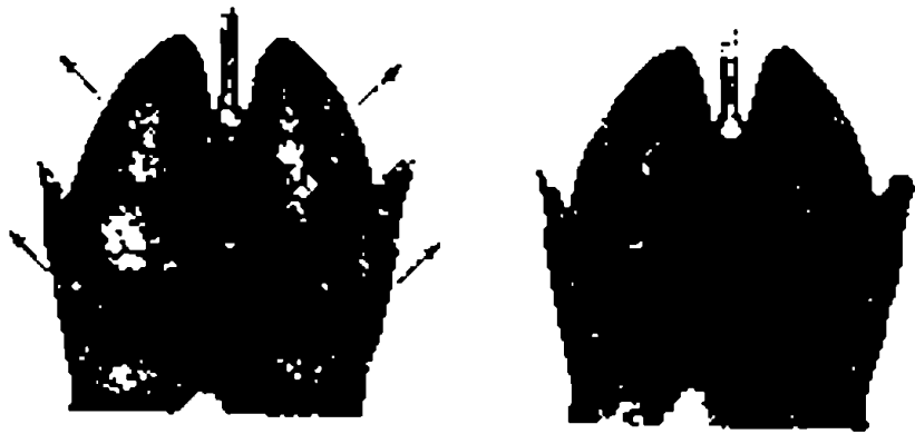
شكل الحجاب الحاجز أثناء عملية التهوية